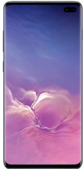
SAMSUNG Galaxy S10+