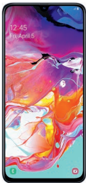
SAMSUNG Galaxy A70