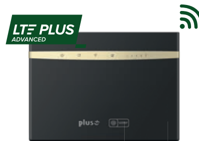
Router stacjonarny HUAWEI B525

Zapytaj Doradcę o rabat 50% na Internet LTE do biura