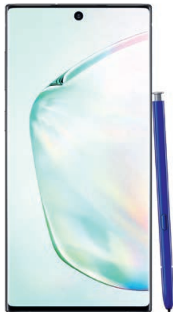
SAMSUNG Galaxy Note10+

Potrzebujesz więcej smartfonów? W Plusie możesz dokupić dodatkowe smartfony bez kosztów abonamentów.