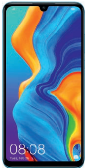
HUAWEI P30 lite