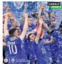
PGE Ekstraliga w ELEVEN SPORTS.